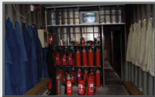
Formation à l'aide de l'unité mobile