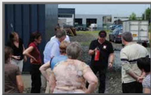
Formation sur site en extérieur

Les formations incendie se font à l'aide de notre unité mobile ou sur votre site, en extérieur.